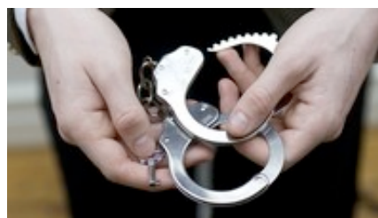
Fångvaktare och projektledare Olle Larsson.